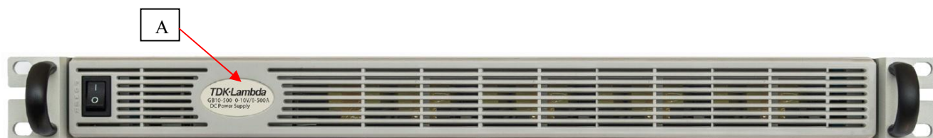
Рисунок 2 – Общий вид источников для варианта исполнения 2 (без жидкокристаллического индикатора, на примере модификаций GB10-500, GB20-250, GB30-170, GB40-125, GB60-85, GB80-65, GB100-50, GB150-34, GB200-25, GB300-17, GB600-8.5), место нанесения знака утверждения типа (А)