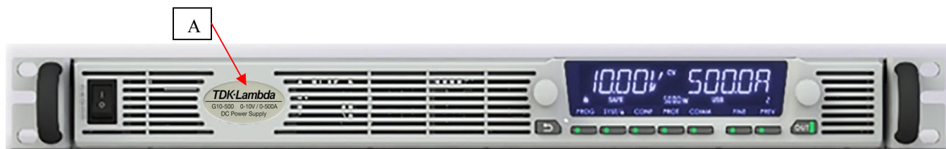
Модификации G10-500, G20-250, G30-170, G40-125, G60-85, G80-65, G100-50, G150-34, G200-25, G300-17, G600-8.5

На рисунке 1 представлен общий вид источников для варианта исполнения 1 и место нанесения знака утверждения типа. На рисунке 2 представлен общий вид источников для варианта исполнения 2 и место нанесения знака утверждения типа. На рисунке 3 представлена схема пломбировки от несанкционированного доступа.