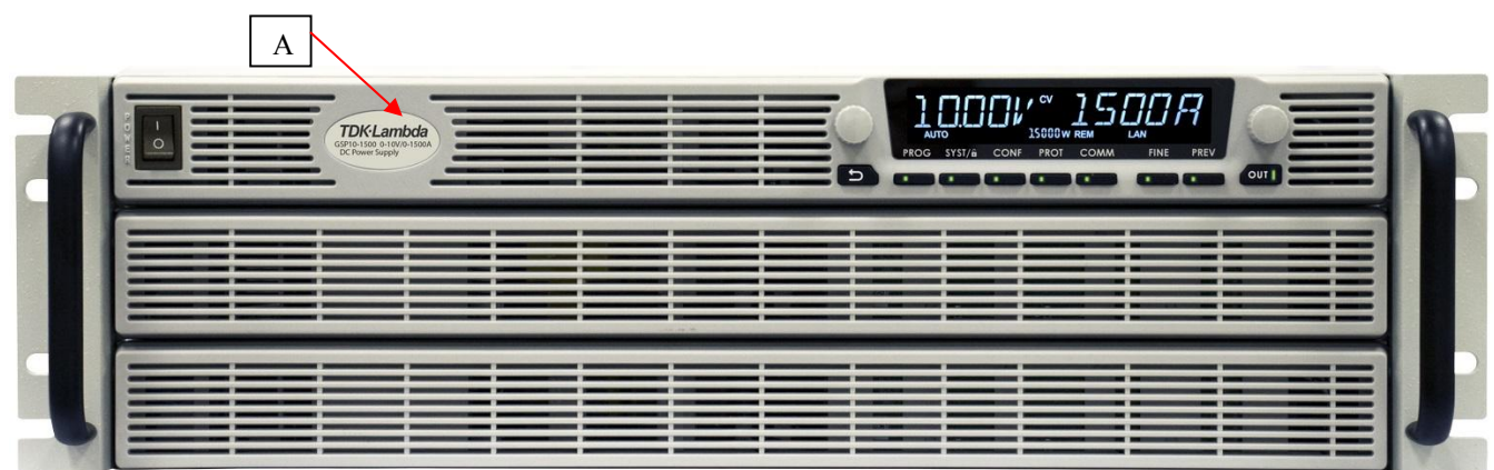
Модификации GSP10-1500, GSP20-750, GSP30-510, GSP40-375, GSP60-255, GSP80-195, GSP100-150, GSP150-102, GSP300-51, GSP600-25.5