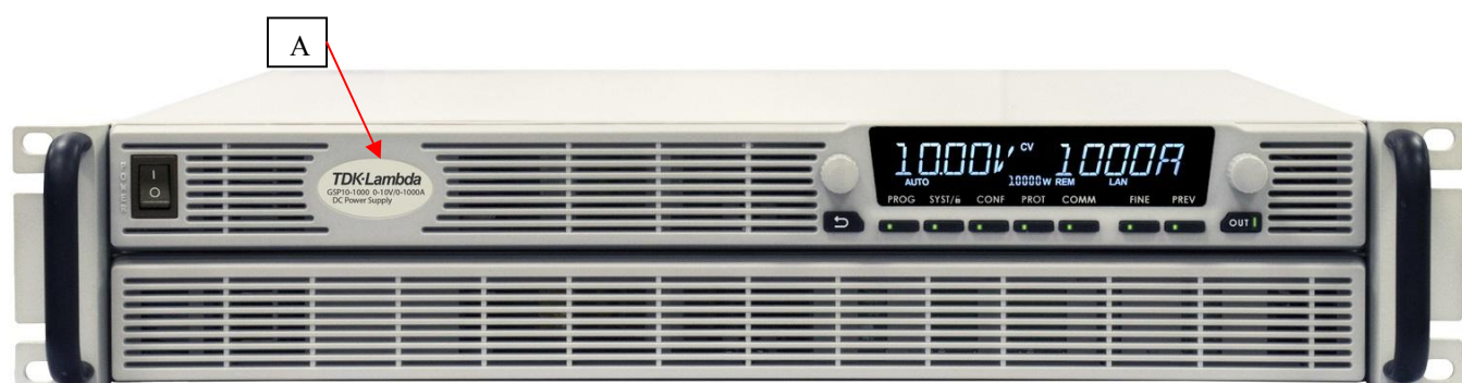
Модификации GSP10-1000, GSP20-500, GSP30-340, GSP40-250, GSP60-170, GSP80-130, GSP100-100, GSP150-68, GSP300-34, GSP600-17