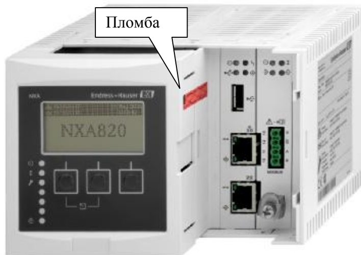
Рисунок 3 - Пломбирование преобразователя NXA820

Для обслуживания, настройки, диагностики компонентов системы с персонального компьютера может использоваться сервисные программы FieldCare и DeviceCare.