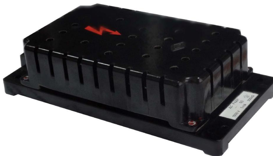
Рисунок 1 – Общий вид сопротивлений добавочных Р4201

Приборы относятся к однофункциональным, восстанавливаемым, ремонтируемым изделиям.