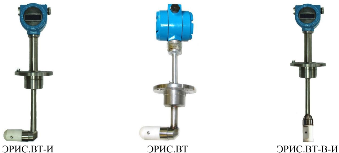
Рисунок 1 – Общий вид датчиков расхода ЭРИС модификации VT

Пломбировка от несанкционированного доступа датчиков расхода ЭРИС осуществляется нанесением знака поверки давлением на специальную мастику, установленную в чашечке винта крепления платы индикации или защитного экрана, расположенных под передней крышкой электронного преобразователя. Схема пломбировки от несанкционированного доступа, обозначение мест нанесения знака поверки датчиков расхода ЭРИС представлена на рисунке 4.