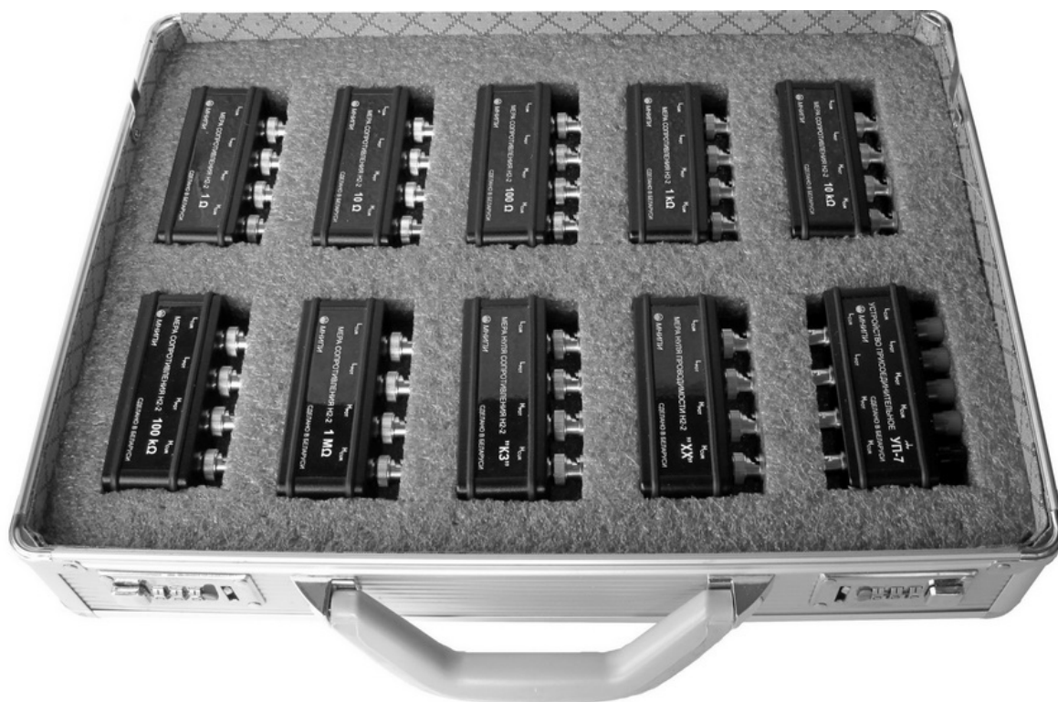
Рисунок 1 – Общий вид набора мер

Схема пломбировки мер для защиты от несанкционированного доступа с указанием места нанесения оттиска знака поверки приведена на рисунке 2.