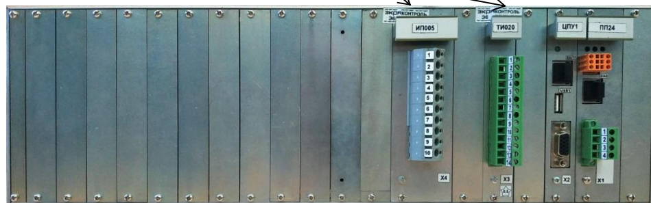
а – вид сзади контроллеров конструктива 18

Место пломбировки изготовителя или организации, выполняющей ремонт