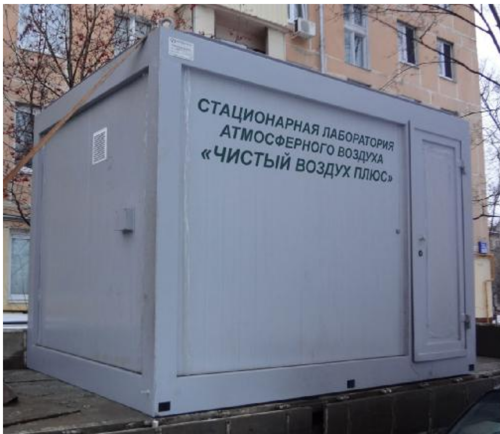
Рисунок 1 - Общий вид стационарной станции

Общий вид станции представлен на рисунках 1 - 4.