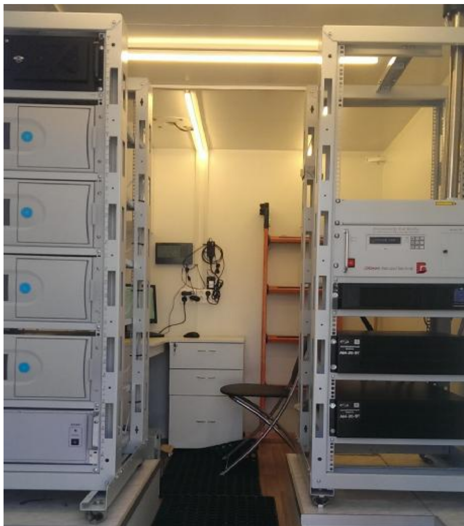
Рисунок 2 – Внешний вид компоновки станции в стационарном исполнении