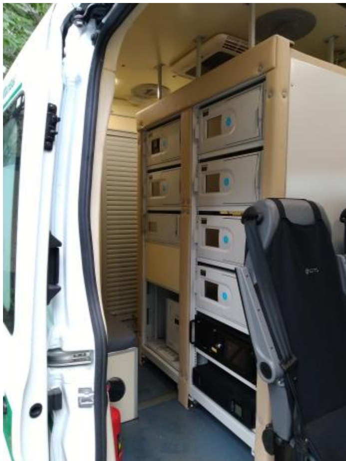
Рисунок 4 – Внешний вид компоновки станции в мобильном исполнении

Для обеспечения защиты от несанкционированного доступа к данным станции требуется пломбировать системный блок компьютера, установленного в стойке. Схема пломбировки от несанкционированного доступа представлена на рисунке 5.