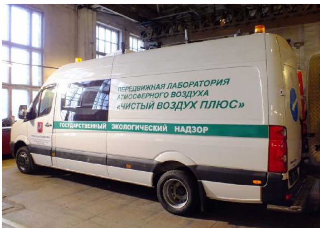
Рисунок 3 - Общий вид мобильной станции