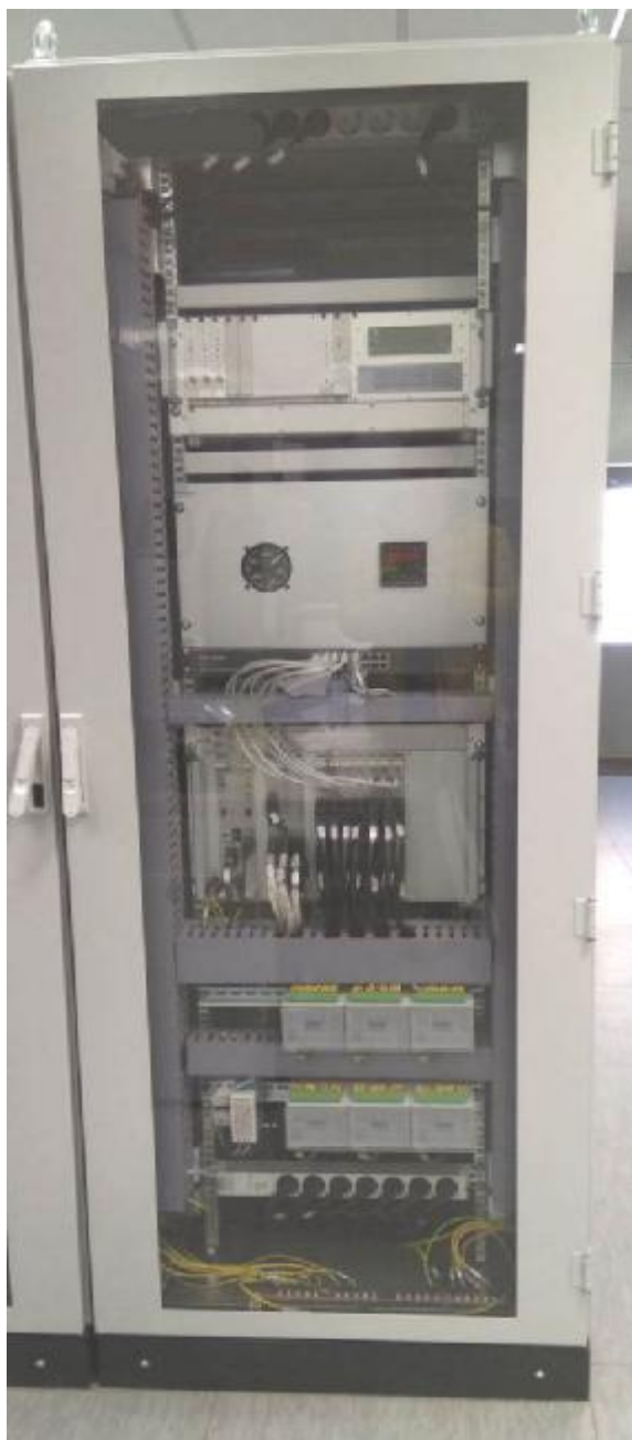
Рисунок 1 - Шкаф измерительного оборудования