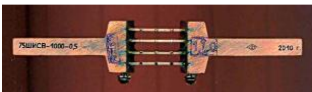
Рисунок 12 - Шунт измерительный стационарный взаимозаменяемый 75ШИСВ