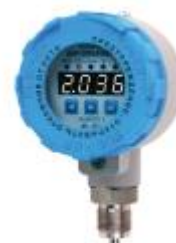
Рисунок 7 - Преобразователь давления измерительный АИР-20/М2