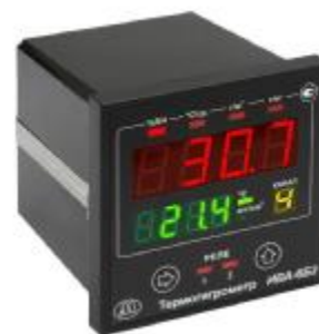
Рисунок 13 - Термогигрометр ИВА-6Б2-К