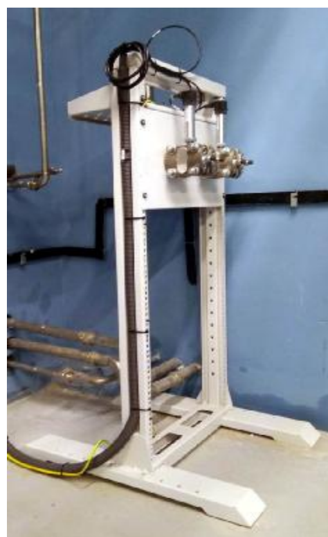
Рисунок 2 - Стойка измерительных преобразователей