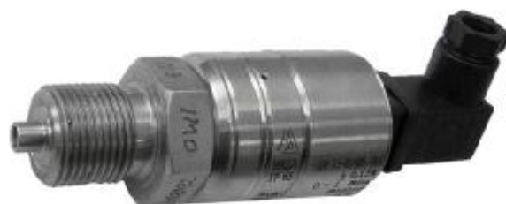
Рисунок 5 - Датчик давления МИДА-15