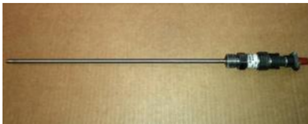
Рисунок 8 - Термопреобразователь сопротивления ТП-9201