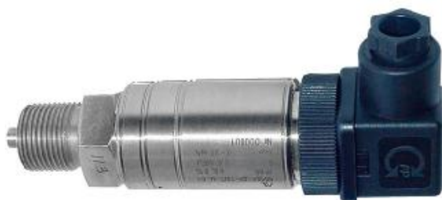
Рисунок 4 - Датчик давления МИДА-13П