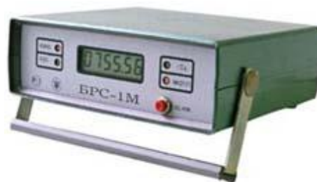
Рисунок 11 - Барометр рабочий сетевой БРС-1М-1