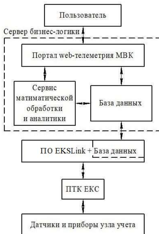
Рисунок 3 - Структурная схема АСУПВ

Структурная схема АСУПВ приведена на рисунке 3.