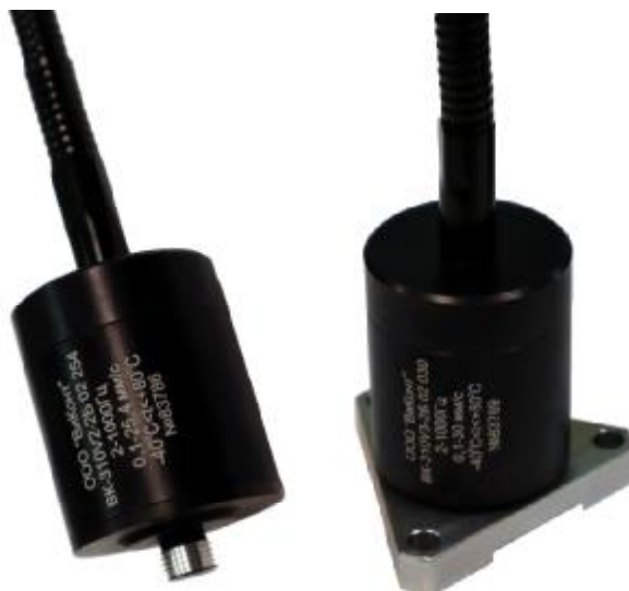
Рисунок 2 - Общий вид вибропреобразователей скорости серии ВК-310 со встроенным предусилителем с аксиальным расположением кабеля