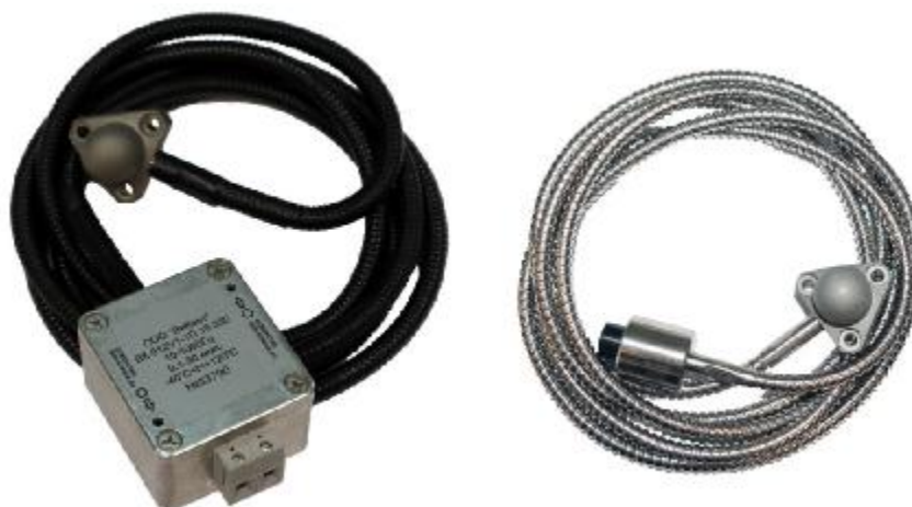
Рисунок 3 - Общий вид вибропреобразователей скорости серии ВК-310 с выносным предусилителем