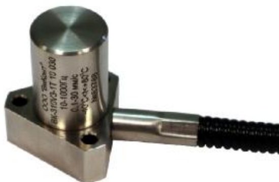
Рисунок 1 - Общий вид вибропреобразователей скорости серии ВК-310 со встроенным предусилителем с боковым расположением кабеля

Пломбирование вибропреобразователей скорости серии ВК-310 не предусмотрено.