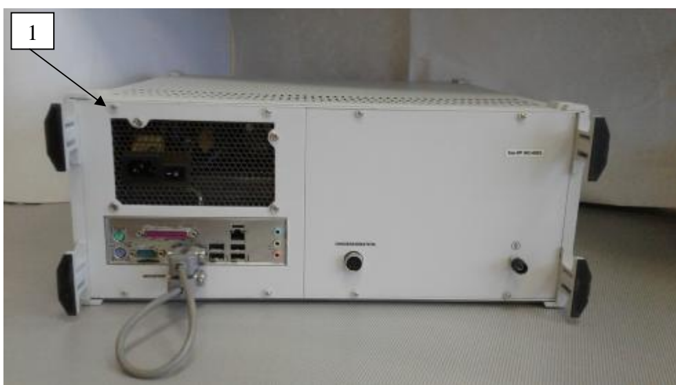
Рисунок 1 – Общий вид измерителя P2-MBM-53. Схема пломбировки от несанкционированного доступа преобразователя детекторного