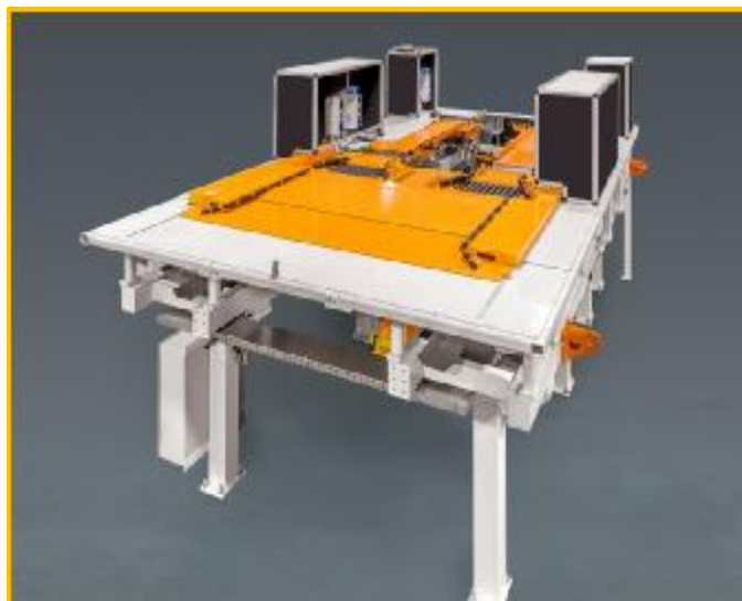
Рисунок 1 - Общий вид стенов для регулировки углов установки колес автомобилей, модель NCA