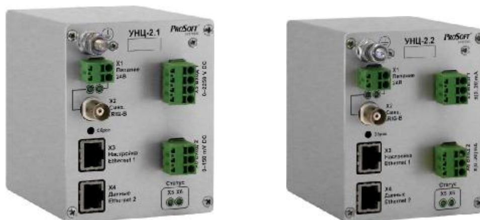
Рисунок 3 – Общий вид измерительных преобразователей УНЦ-2.1 и УНЦ-2.2