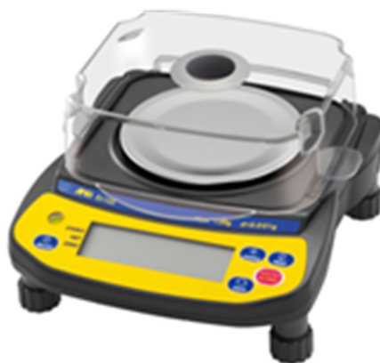
в) модификации EJ-123, EJ-303