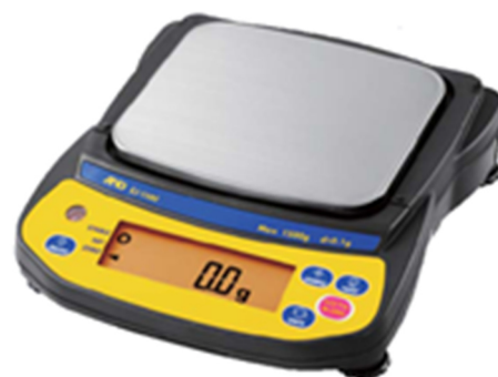
б) модификации EJ-1202, EJ-1500, EJ-2000, EJ-3000, EJ-3002, EJ-6100