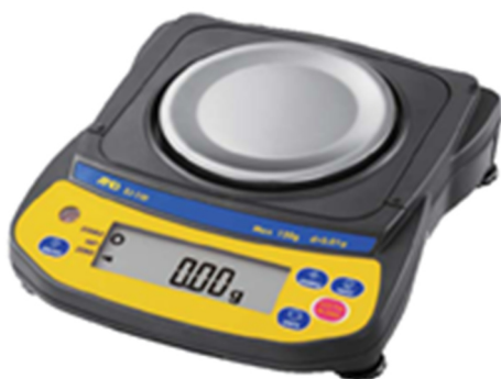
а) модификации EJ-120, EJ-200, EJ-300, EJ-610

Весы оснащены интерфейсами USB, RS-232C для связи с периферийными устройствами (например, персональный компьютер, принтер).