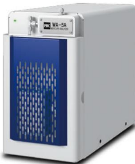
Рисунок 1 - Общий вид анализаторов ртути

Схема пломбировки от несанкционированного доступа представлена на рисунке 2.