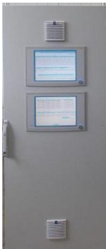
Рисунок 1 – Общий вид средства измерений

Пломбировка контроллера измерительно-вычислительного СОИ СИКН № 124 осуществляется путем пломбировки контроллера программируемого логического REGUL RX00 модели REGUL R600, входящего в его состав, нанесением знака поверки методом давления на свинцовую (пластмассовую) пломбу, установленную на проволоке.