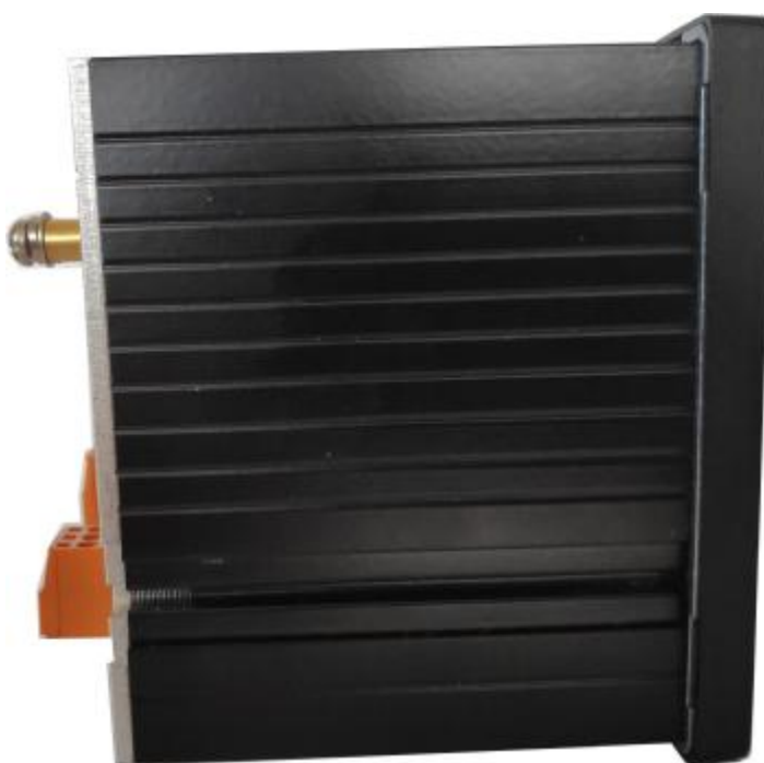
Рисунок 3 – Вид крепления синхроноскопов щитовых ЩС96