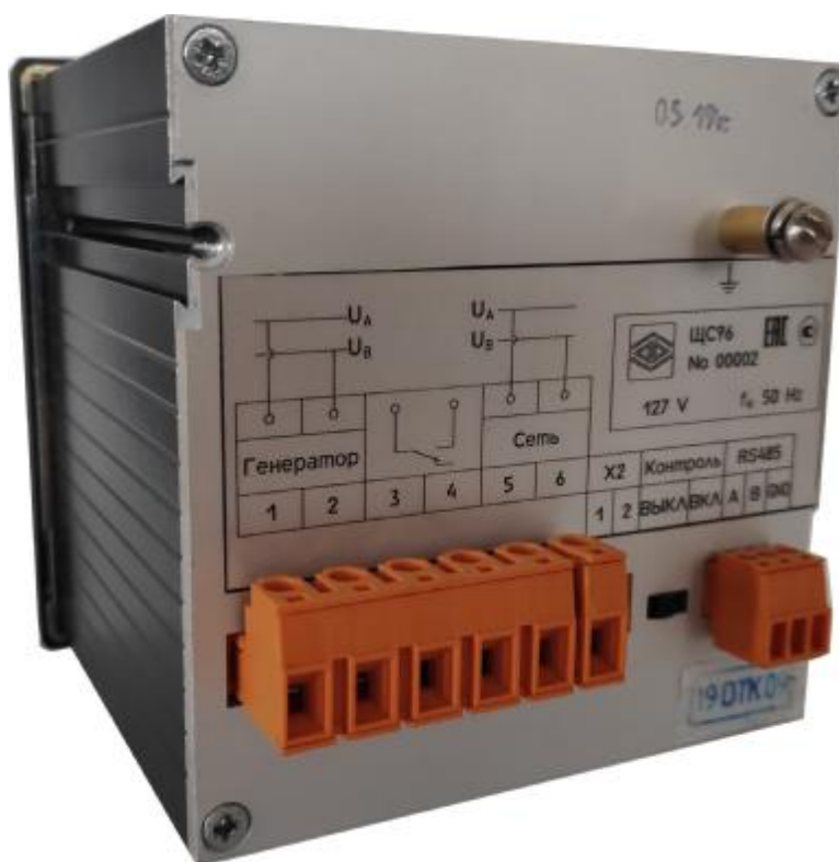
Рисунок 2 – Общий вид синхроноскопов щитовых ЩС96 (оборотная сторона)