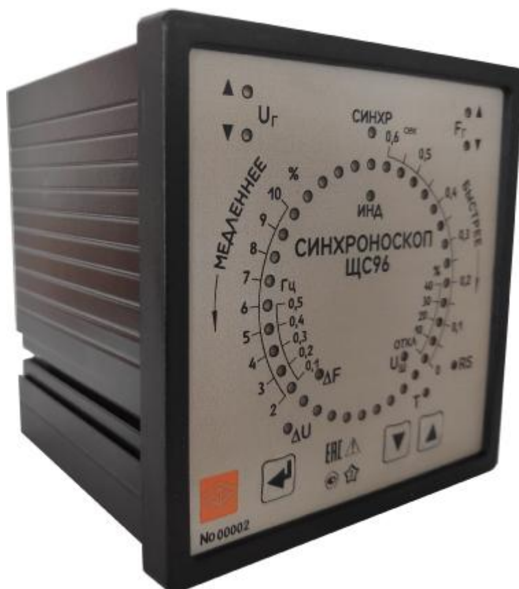
Рисунок 1 – Общий вид синхроскопов щитовых ЩС96 (лицевая сторона)

Приборы являются восстанавливаемыми, ремонтируемыми изделиями.