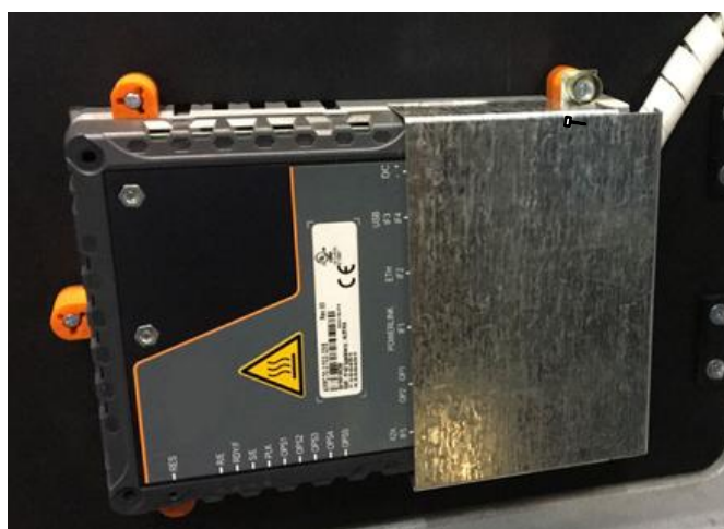
Рисунок 2 – Схема пломбировки от несанкционированного доступа и обозначение мест нанесения знаков на фланцевые соединения средств измерений массы, объема и плотности, и чашечку винта крепления закрывающей пластины контроллера установок