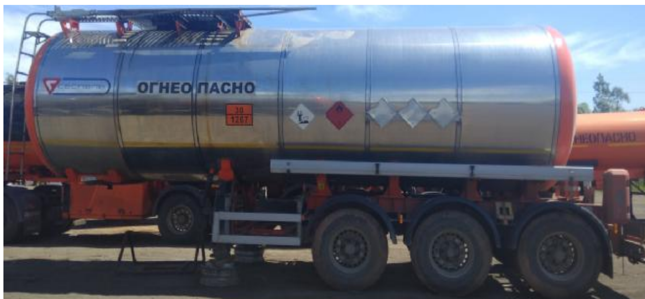
Рисунок 1 - Общий вид полуприцепа-цистерны SF3B30

Схема пломбировки для защиты от несанкционированного изменения положения указателя уровня налива, обозначение мест нанесения знака поверки представлены на рисунке 2.