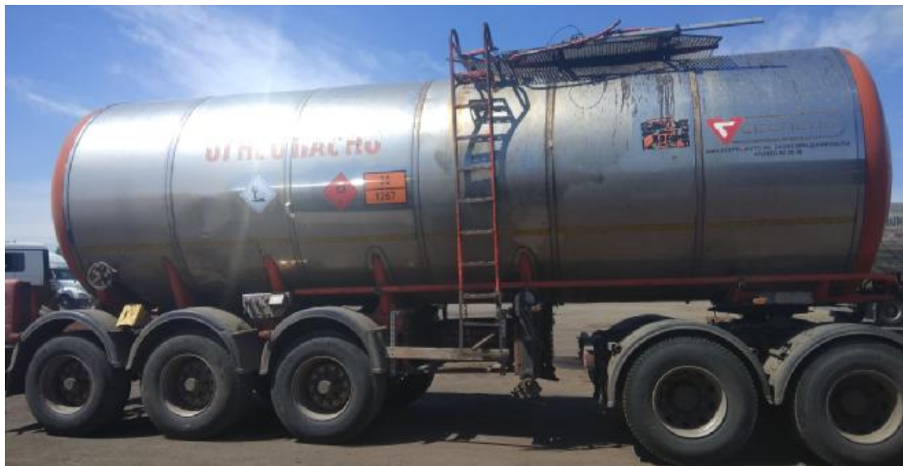
Рисунок 1 - Общий вид полуприцепа-цистерны 964872