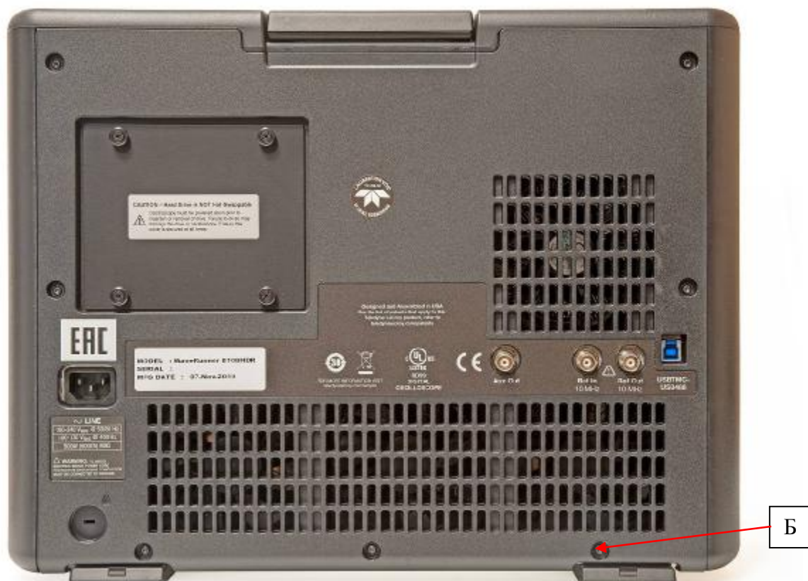
Рисунок 2 – Схема пломбировки от несанкционированного доступа (Б)