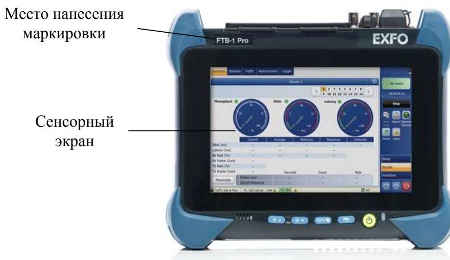
Рисунок 1 – Общий вид систем

Схема пломбировки от несанкционированного доступа, обозначение места нанесения знака поверки представлены на рисунке 2.