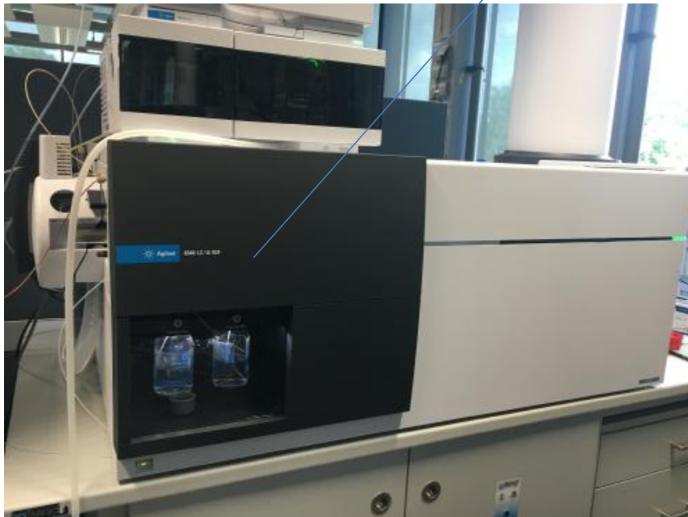
Рисунок 2 – Общий вид детекторов 6546 LC/Q-TOF (модель 6546)