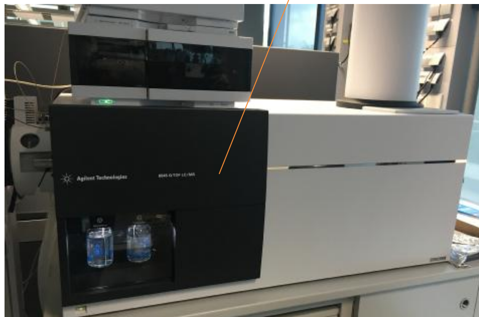
Рисунок 1 – Общий вид детекторов 6545 Q-TOF LC/MS (модель 6545) и 6545XT AdvanceBio LC/Q-TOF (модель 6549)