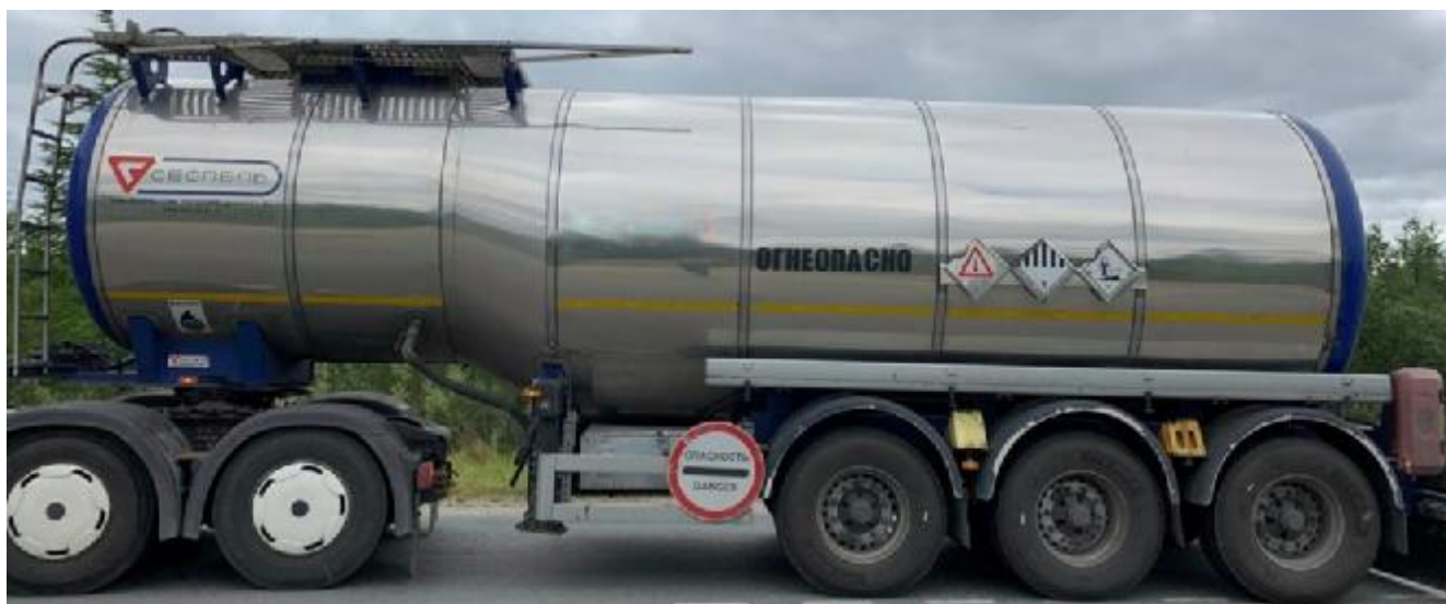
Рисунок 1 - Общий вид полуприцепа-цистерны SF3B28

Схема пломбировки для защиты от несанкционированного изменения положения указателя уровня налива, обозначение мест нанесения знака поверки представлены на рисунке 2.