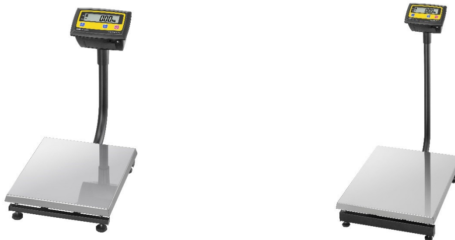
модификации EM-30KAM, EM-60KAM

Весы оснащены интерфейсом RS-232C для связи с периферийными устройствами (например, персональный компьютер, принтер).