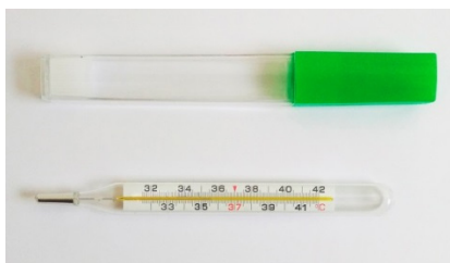
а) термометр с диапазоном измерений от +32 до +42 °С в пластмассовом футляре

Нанесение знака поверки на термометры не предусмотрено. Пломбирование термометров не предусмотрено.