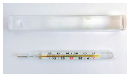
б) термометр с диапазоном измерений от +32 до +42 °С в футляре с увеличительной линзой