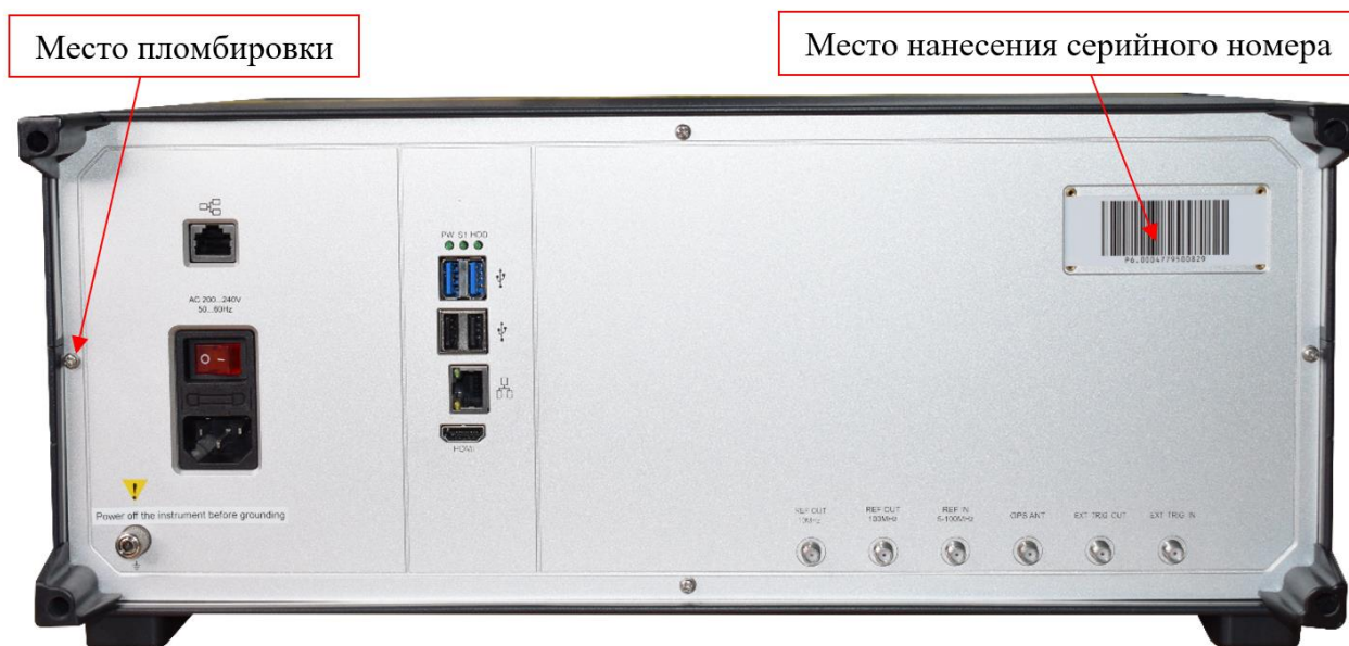
Рисунок 2 - Схема пломбировки от несанкционированного доступа и место нанесения серийного номера, идентифицирующего каждый экземпляр СИ