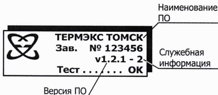
Рисунок 1 — Наименование и версия ПО

Результаты проверки ПО считают положительными, если на дисплее отображается идентификационное наименование «ТЕРМЭКС ТОМСК» и версия ПО не ниже 1.0.0.