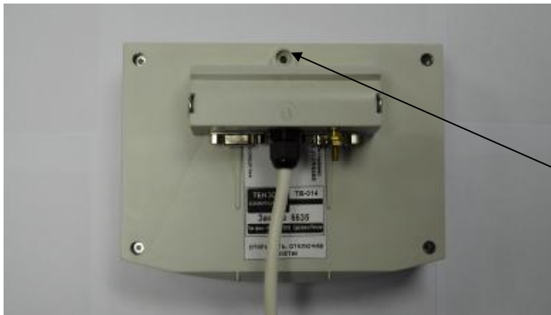
Рисунок 1 – Место пломбировки от несанкционированного доступа на преобразователе ТВ-014.

4.2.2 Проверяют наличие пломбировки на преобразователе ТВ-014 (Рис. 1).