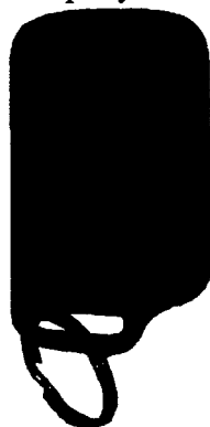
Рисунок 1 – Пульт для перевода счетчика в режим расширенной индикации

Примечание: счетчик с электронным отсчетным устройством переводится в режим расширенной индикации накопленного объема с помощью специального пульта, изображенного на рисунке 1. Данный пульт можно запросить у ООО «КУНДИС ГмБХ» - официального представителя изготовителя в России. Необходимо направить пульт на инфракрасный приемник счетчика на расстоянии 20 см, и нажать кнопку на пульте. Дождавшись, когда на пульте загорелся зеленый светодиод, кнопку можно отпустить. Жидкокристаллический экран счетчика, переведенного в режим расширенной индикации, представлен на рисунке 2.