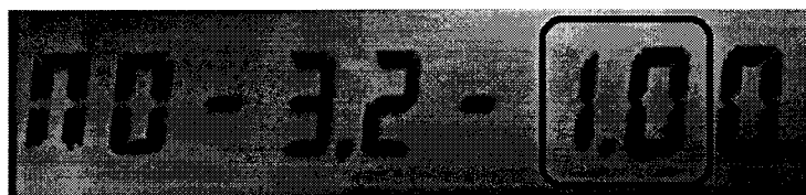
Рисунок 1, номера версии (идентификационного номера) ПО СИ «Счётчик газа бытовой «ДТСГ-3,2»

Для определения номера версии (идентификационного номера) ПО СИ «Счётчик газа бытовой «ДТСГ-3,2» необходимо включить счетчик. На индикаторе выведется номер версии (идентификационный номер) ПО – 1.0, рисунок 1.