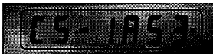
Рисунок 2, цифровой идентификатор ПО СИ «Счётчик газа бытовой «ДТСГ-3,2»

Для определения цифрового идентификатора ПО СИ «Счётчик газа бытовой «ДТСГ-3,2» необходимо включить счетчик. На индикаторе выведется цифровой идентификатор ПО – CS1A53, рисунок 2.