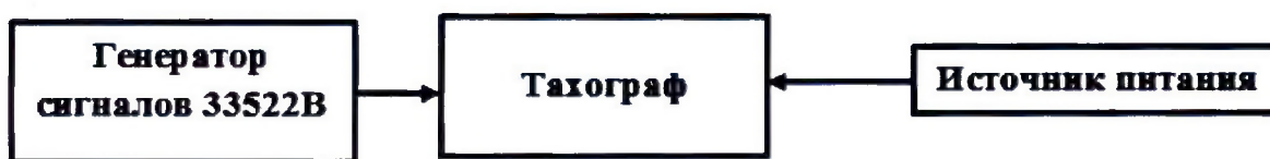
Рисунок 3 – Схема проведения измерений при определении инструментальной погрешности измерения скорости по датчику движения

8.5.1 Собрать схему в соответствии с рисунком 3.