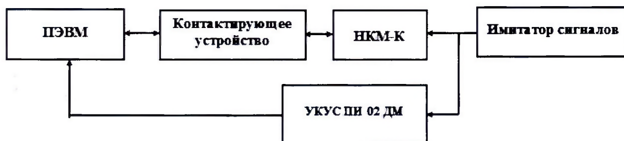
Рисунок 2 – Схема проведения измерений при определении абсолютной погрешности синхронизации

8.3.1 Собрать схему в соответствии с рисунком 2. Количество одновременно проверяемых блоков определяется количеством используемых контактирующих устройств.