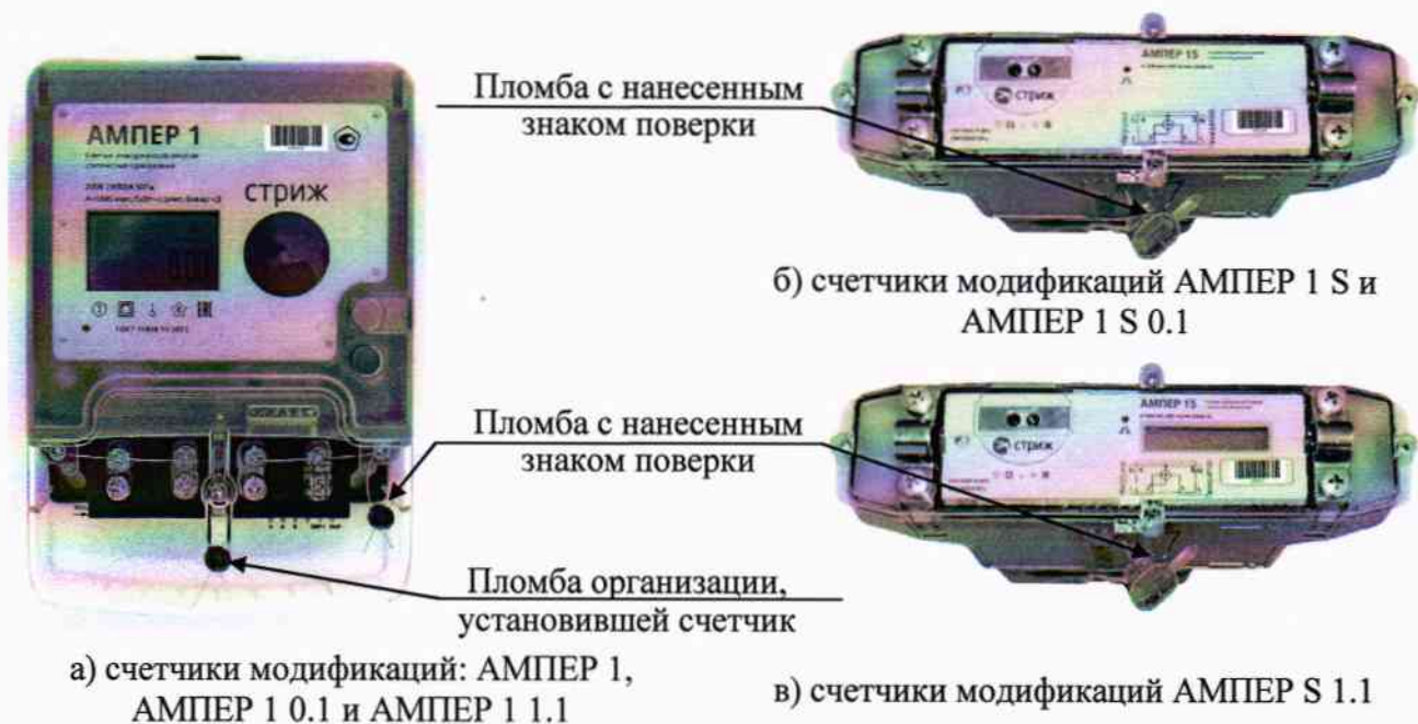
Рисунок 7.1 – Схемы пломбировки счетчиков

7.5 При отрицательных результатах поверки счетчики к применению не допускают, свидетельство о поверке аннулируют, выдают извещение о непригодности с указанием причин в установленном порядке, а счетчики направляют в ремонт или для настройки (регулировки) производителю или авторизованной сервисной организации.