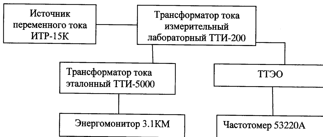
Рисунок 5. Схема для определения погрешности коэффициента преобразования силы переменного и постоянного тока

1 Собирают схему подключений согласно рисунку 1 (для силы постоянного тока) и схему по рисунку 5 (для силы переменного тока).