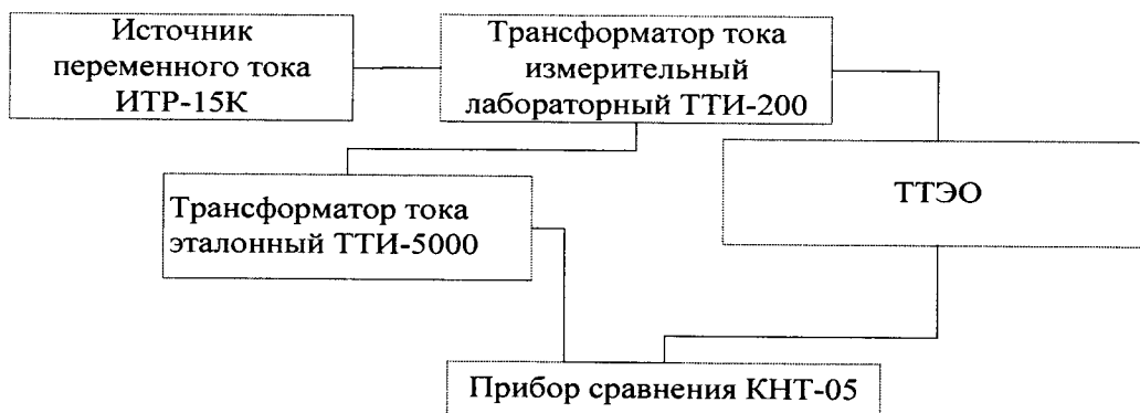
Рисунок 2. Схема для определения погрешности коэффициента масштабного преобразования и угла фазового сдвига силы переменного тока

4. Получают значения погрешности коэффициента масштабного преобразования и угла фазового сдвига с прибора сравнения КНТ-05.