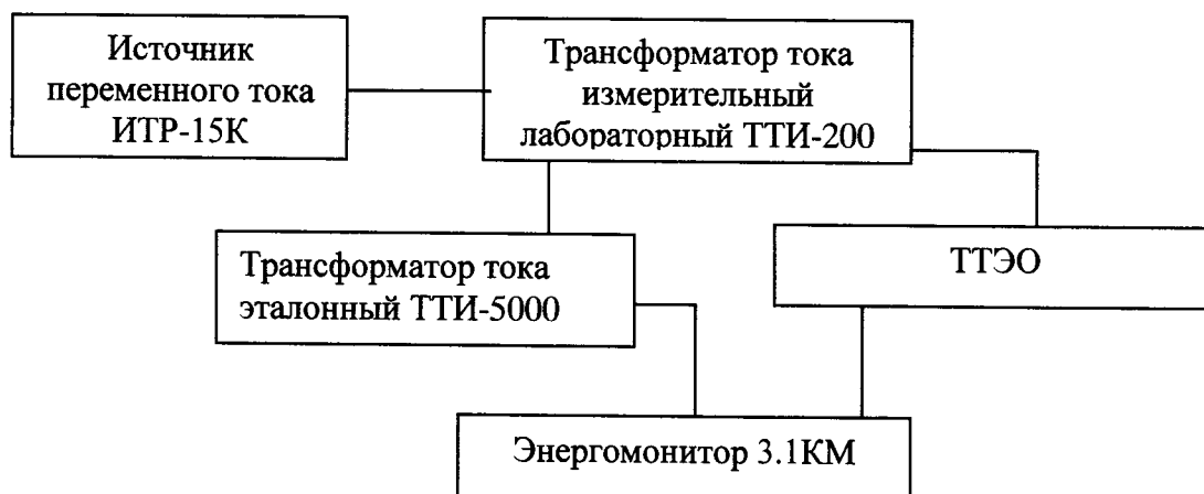
Рисунок 4. Схема для определения погрешности коэффициента преобразования силы переменного и постоянного тока

1. Собирают схему подключений согласно рисунку 1 (для силы постоянного тока) и схему по рисунку 4 (для силы переменного тока).