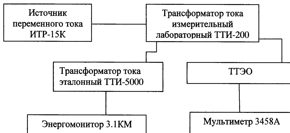
Рисунок 6. Схема для определения погрешности коэффициента преобразования силы переменного и постоянного тока

2 Воспроизводят испытательный сигнал с помощью источника в соответствии с таблицей 2.