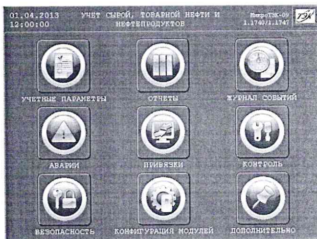
Рисунок 1 – Идентификационные данные ПО

8.5.1.2 Проверку идентификационного наименования и номера версии ПО ИВК проводят сравнением данных, приведённых в 8.5.1.1 настоящей МП и отображаемых в верхнем правом углу главного окна дисплея ИВК (рисунок 1).