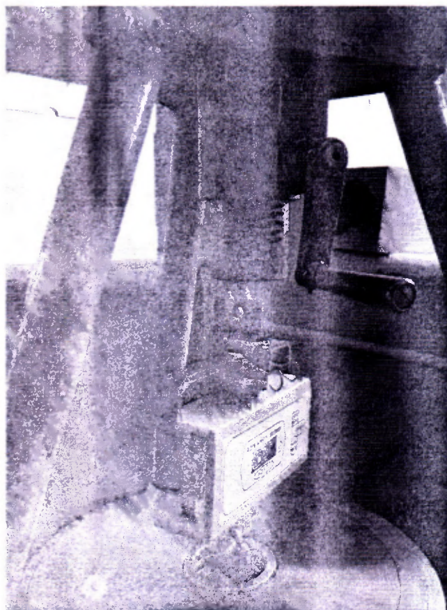
Рисунок 1 – Пример подготовки адгезиметра к проверке

Перевести адгезиметр в режим «АДГЕЗИЯ». В режиме измерения «АДГЕЗИЯ» запуск нового цикла автоматических измерений адгезии производится нажатием кнопки «ВХОД/НОЛЬ» после этого плавно прикладываем нагрузку 5 кгс, подвесив гирию на крюк адгезиметра.