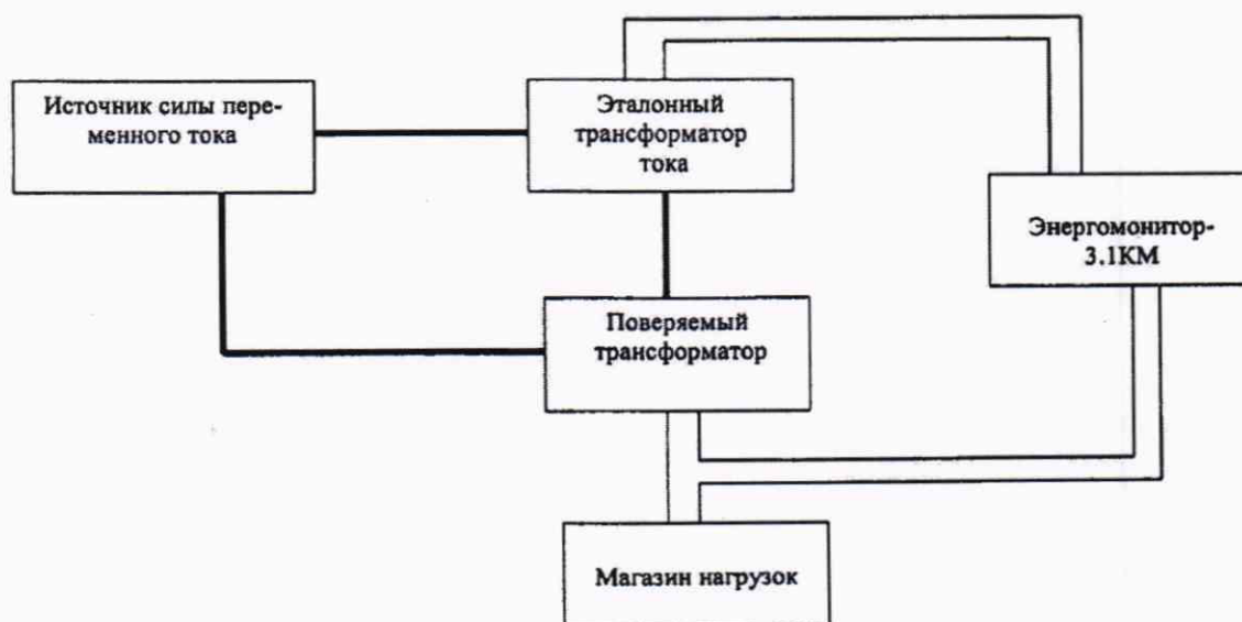
Рисунок 1 - Структурная схема определения погрешностей

- для защитных обмоток трансформаторов классов точности 5P, 10P, 5PR, 10PR, PX, TPX, TPU, TPZ проверка проводится только при I_{ном} и номинальном значении вторичной нагрузки S_{ном} ( S_{маг} ).