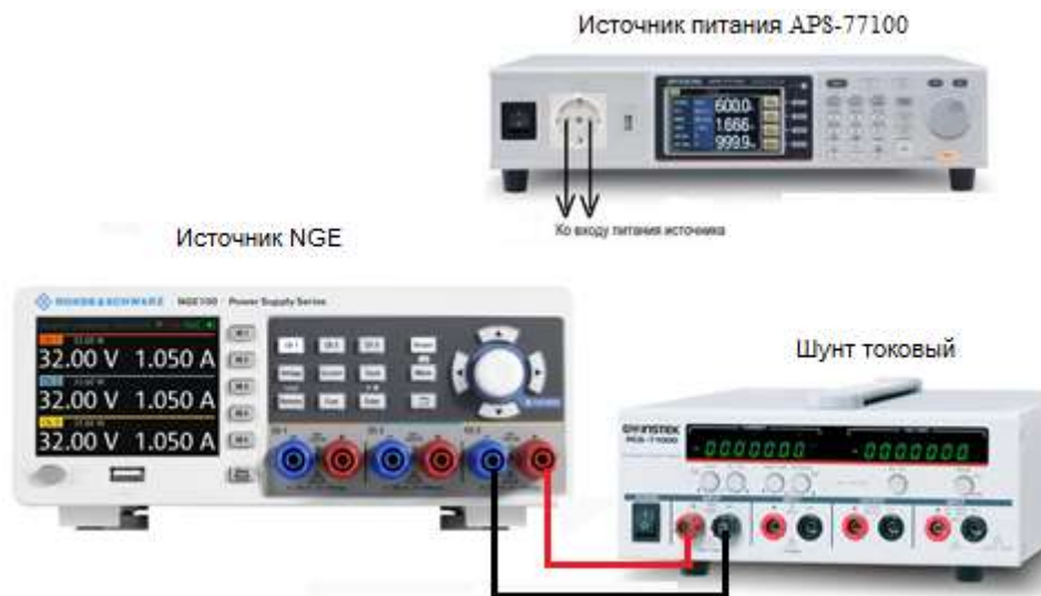
Рисунок 4 – Структурная схема соединения приборов для измерения параметров выходного тока источника

7.8.3 Подключение поверяемого источника к шунту PCS-71000 производить согласно руководству по эксплуатации и в соответствии с рисунком 4. Выбор предела измерения на шунте осуществлять исходя из максимального значения силы тока на выходе источника. Предел измерения силы тока шунта должен быть больше установленного значения силы тока на источнике.