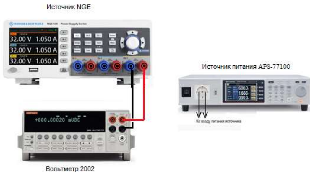
Рисунок 1 – Структурная схема соединения приборов для определения параметров выходного напряжения источников

7.4.1 Собрать измерительную схему, представленную на рисунке 1. Подключить вход сетевого питания поверяемого источника ко выходу источника питания APS-77100. На источнике питания APS-77100 установить напряжение, равное номинальному (230 В), контролируя его при помощи встроенного вольтметра. Мультиметр цифровой 2002 (далее вольтметр 2002) подключить к выходу поверяемого источника.