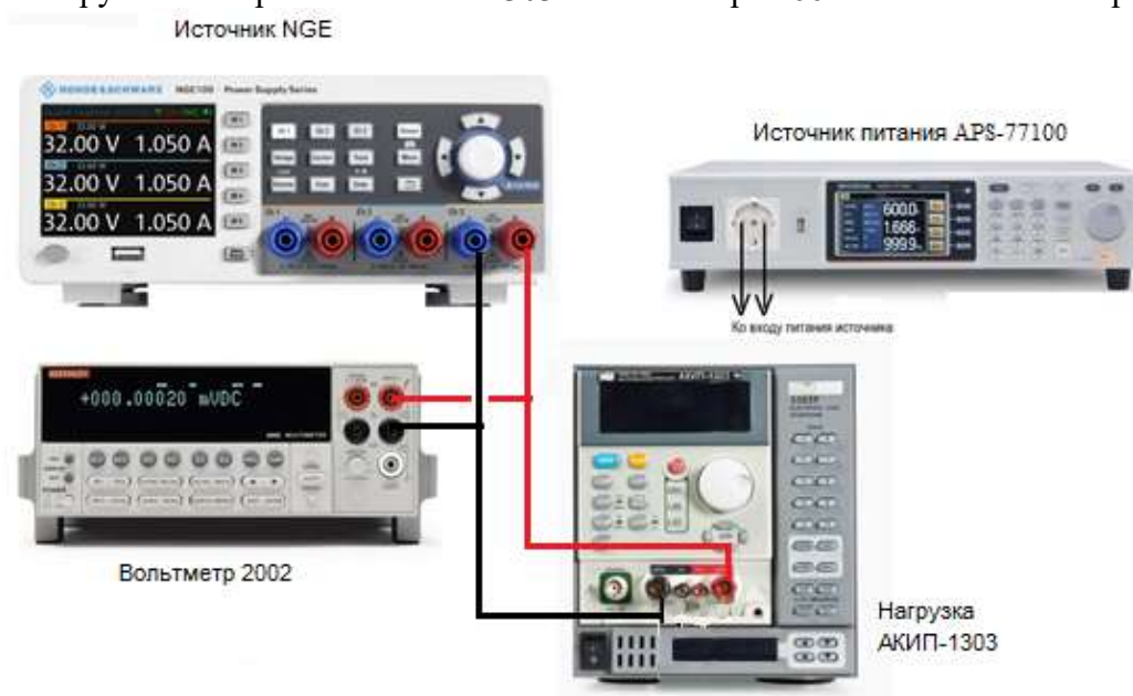
Рисунок 2 – Структурная схема соединения приборов для определения нестабильности выходного напряжения источников

7.5.1 Подключить вход сетевого питания поверяемого источника ко выходу источника питания APS-77100. На источнике питания APS-77100 установить напряжение, равное номинальному (230 В), контролируя его при помощи встроенного вольтметра. Разъемы поверяемого источника соединить при помощи измерительных проводов с соответствующими разъемами нагрузки электронной АКИП-1303 и вольтметра 2002 в соответствии с рисунком 2.