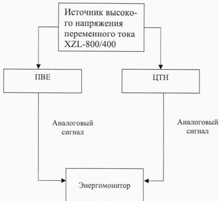
Рисунок 3 – Структурная схема определения метрологических характеристик при измерении напряжения переменного тока (для аналоговых выходов)

3) При помощи источника высокого напряжения переменного тока XZL-800/400 воспроизвести номинальное значение испытательного напряжения переменного тока на поверяемый ЦТН и ПВЕ в зависимости от номинального значения напряжения.