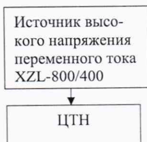
Рисунок 1 – Структурная схема определения электрической прочности изоляции