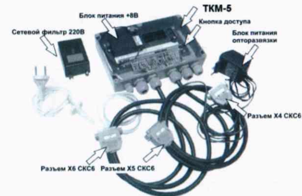
Рис. Д.3 Внешний вид ТКМ-5

Примечание: Технологический коммутационный модуль ТКМ-5 поставляются изготовителем вычислителя по отдельному заказу.