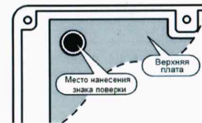
Рис. Д.4 Место нанесения знака поверки - на крепежный винт защитного каркаса электронного модуля (р.10.4 РЭ)

Примечание: Технологический коммутационный модуль ТКМ-5 поставляются изготовителем вычислителя по отдельному заказу.