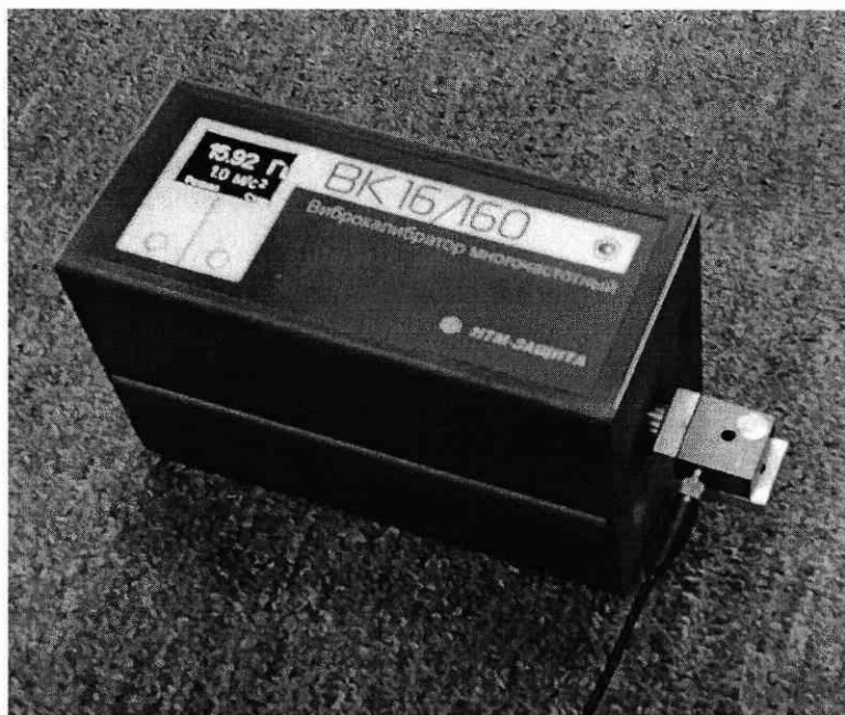
Рисунок 5. Использование углового адаптера.