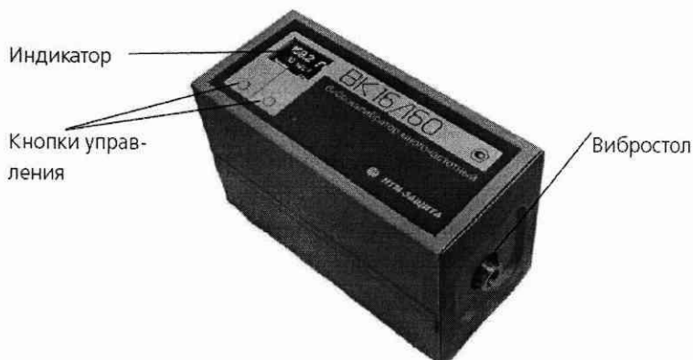
Рисунок 1. Виброкалибратор многочастотный «ВК 16/160»

1.4.4. Управление работой калибратора осуществляется кнопками на верхней панели, рисунок 1.