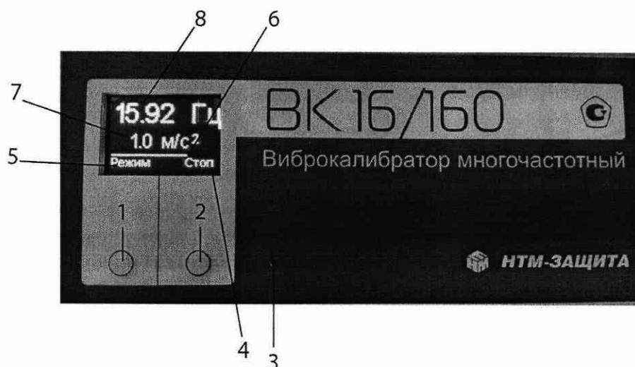
Рисунок 2. Назначение кнопок управления и содержание экрана индикатора. 1 – кнопка включения/выключения и переключения режимов; 2 – кнопка запуска и остановки воспроизведения колебаний; 3 – контрольный светодиод зарядки аккумуляторов; 4,5 – текущее назначение кнопок; 6 – индикатор времени воспроизведения колебаний; 7 – СКЗ ускорения установленного режима; 8 – частота колебаний установленного режима.