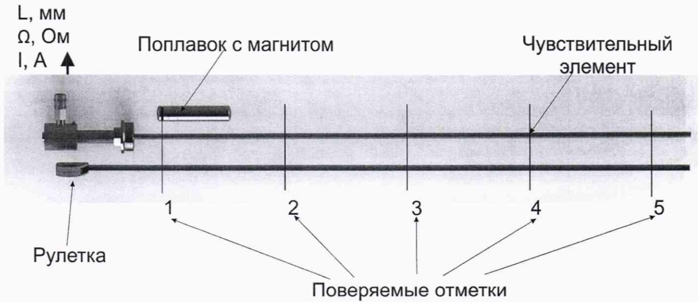
Рисунок 3 – Проверка уровнемера с помощью рулетки и магнитного поплавка