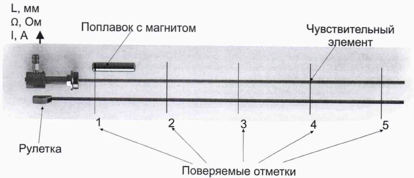
Рисунок 3 – Поверка уровнемера с помощью рулетки и магнитного поплавка