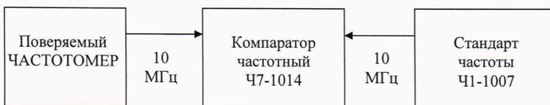
Рисунок 1 – Схема определения нестабильности и относительной погрешности по частоте опорного генератора частотомера

7.4.2 Подать сигнал с выхода частоты 10 МГц опорного генератора испытываемого частотомера на разъем ВХОД f_x компаратора Ч7-1014. От стандарта частоты и времени водородного Ч1-1007 (далее стандарт частоты Ч1-1007) подать сигнал на разъем ВХОД f_0 компаратора Ч7-1014. Установить время измерения равным 10 с. Задать число измерений n равным 10, записать среднее значение относительного отклонения частоты. Записать в протокол относительную погрешность по частоте опорного генератора при поступлении на испытания.