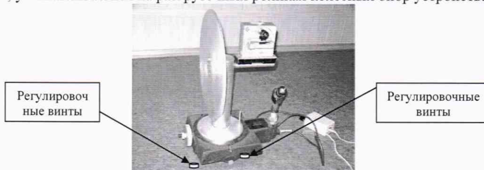
Рисунок 1 - Установка угломерная на основе столов поворотных СТ-9

7.4.1.1 Проверку диапазона измерений углов развала колес проводить с помощью квадранта оптического, путем последовательной попарной установки (соответственно на местах размещения передней и задней осей автомобиля) установок угломерных на основе столов поворотных СТ-9 (далее - установки угломерные). Установки угломерные (Рис. 1) размещаются на площадках, устанавливаемых на разгрузочных роликах колесных опор устройства.