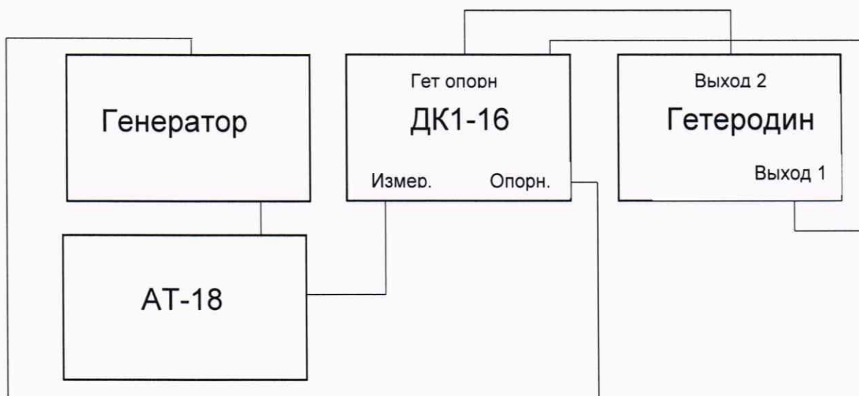
Рисунок 1 – Схема подключения для определения диапазона и абсолютной погрешности установки ослабления в диапазоне частот от 0 до 1,1 ГГц.

10.3.1.12 Повторить операции п.п. 9.3.1.7 – 9.3.1.11 на частотах 8; 12; 17,85 ГГц.