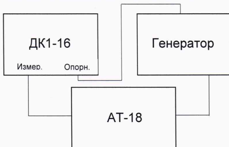
Рисунок 2 – Схема подключения для определения диапазона и абсолютной погрешности установки ослабления в диапазоне частот от 1,1 до 17,85 ГГц.

10.3.2 Методика расчета абсолютной погрешности установки ослабления во всем диапазоне частот приведена в пункте 10.3. Записать «Текущее значения ослабления» установленное на аттенюаторе и значение разностного ослабления измеренное ДК1-16.