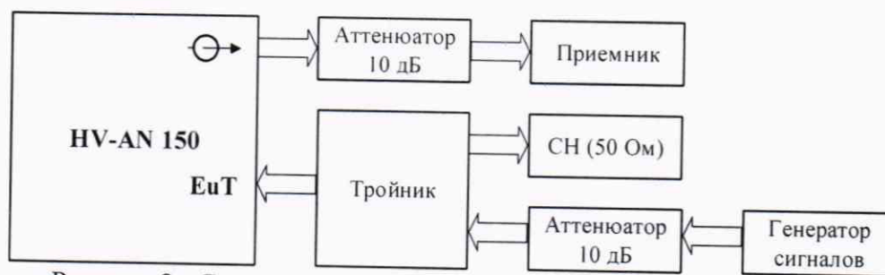
Рисунок 2 - Схема измерений выходного уровня эквивалента сети

Выход генератора Г4-219 посредством радиочастотного кабеля с подключить к входу «EuT» эквивалента сети (на частотах свыше 10 МГц использовать генератор SMR40). Выход «⊕» эквивалента сети подключить к входу приемника измерительного R&S ESU8.