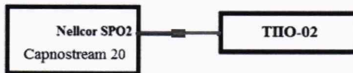
Рисунок 3 – Условная схема подключения

Согласно руководству по эксплуатации в тестере пульсовых оксиметров ТПО-02 устанавливаем тип датчика «Nellcor», вид кривой PLE1, частота пульса-70 мин -1 .