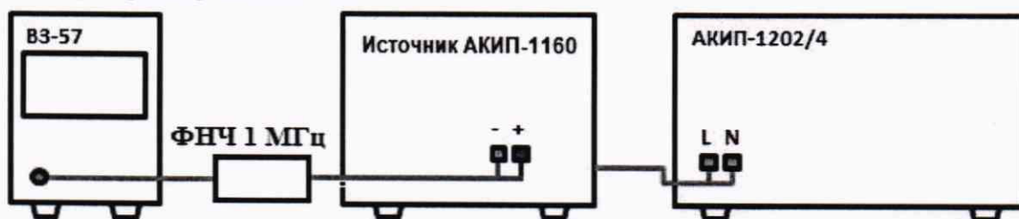
Рисунок 3 – Схема соединения приборов для определения уровня пульсаций выходного напряжения

9.3.1 Подключить микровольтметр ВЗ-57 к выходным разъемам источника. Подключение осуществлять через фильтр нижних частот 1 МГц.