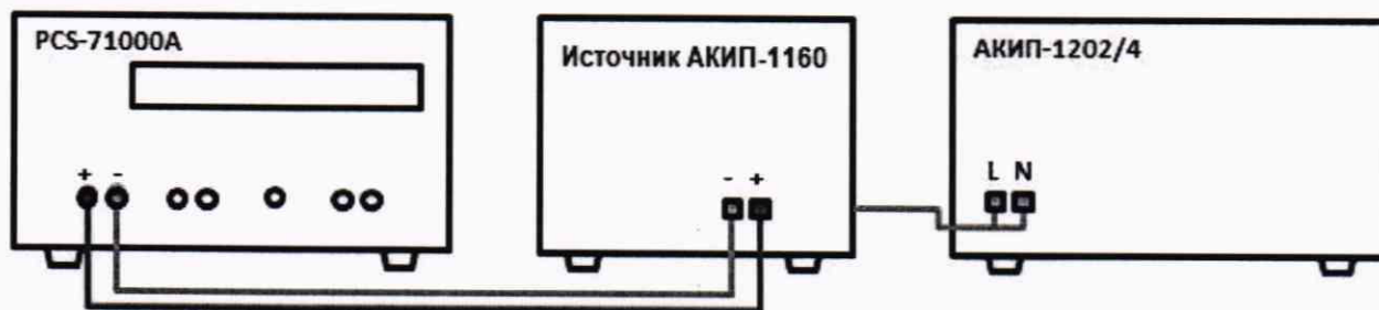
Рисунок 2 – Схема соединения приборов для определения погрешности установки/измерений силы постоянного тока

9.2.1 Собрать измерительную схему, представленную на рисунке 2. Выбор предела измерения на шунте осуществлять исходя из максимального значения силы тока на выходе источника. Предел измерения силы тока шунта должен быть больше установленного значения силы тока на источнике.