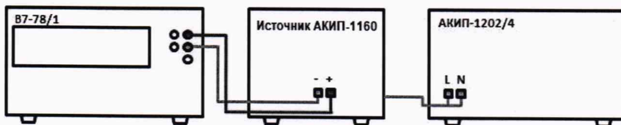
Рисунок 1 – Схема соединения приборов для определения погрешности установки/измерений напряжения постоянного тока

9.1.1 Собрать измерительную схему, представленную на рисунке 1.